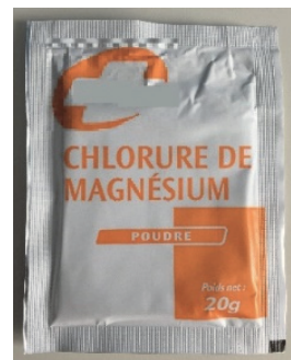
Photographie d'un sachet de chlorure de magnésium en pharmacie

La poudre présente dans le sachet est du chlorure de magnésium hydraté pur, de formule \text{MgCl}_2 \cdot 4,5 \text{ H}_2\text{O} , où 4,5 est appelé le degré d'hydratation. Celui-ci représente le nombre de moles d'eau présentes dans une mole de chlorure de magnésium hydraté.